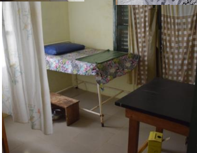
Verloskamer met twee bedden