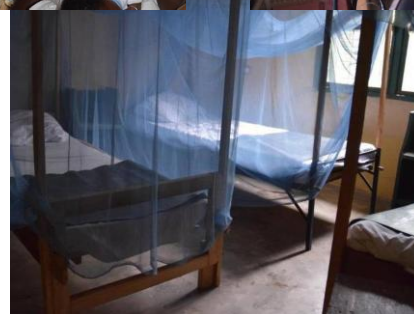
Kamer voor korte observatie na de bevalling

In de nieuwe kliniek komen twee aparte verloskamers. Net bevallen moeders kunnen blijven als dit nodig is. Er zullen twee voor de tropen ontwikkelde couveuses beschikbaar zijn. Ook de grotere kinderen hoeven ze niet meer naar huis te sturen als behandeling nodig is.