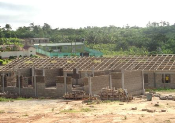
Kinderopnameafdeling op de voorgrond, oogafdeling erachter