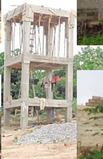
Voor de 3 watertanks